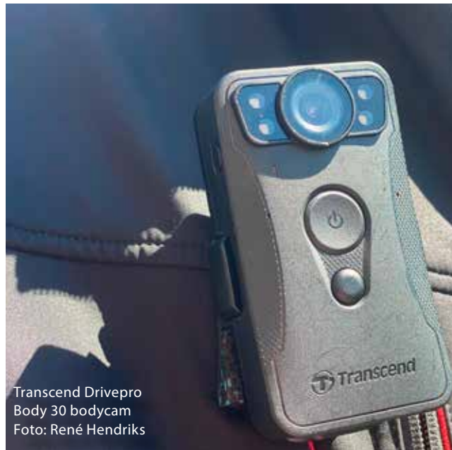
Transcend Drivepro Body 30 bodycam

De betere modellen hebben voldoende accu en flashgeheugen om een uur of 8 op te nemen;