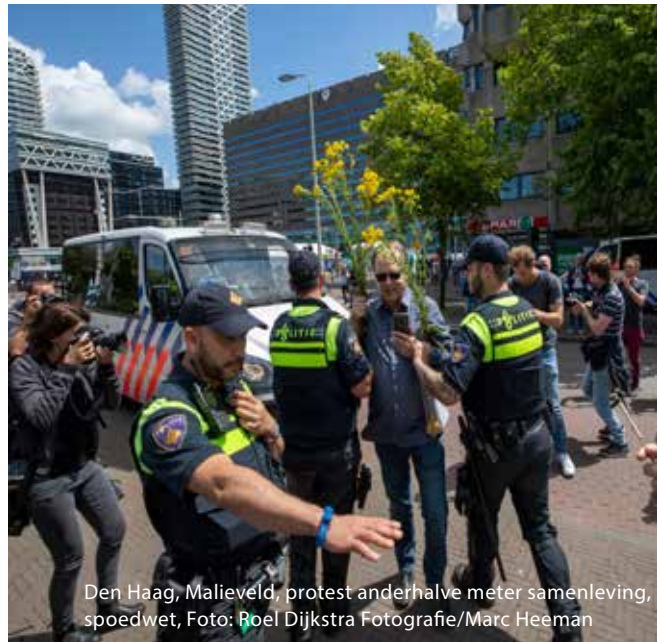
Den Haag, Malieveld, protest anderhalve meter samenleving, spoedwet, Foto: Roel Dijkstra Fotografie/Marc Heeman

Rechtshulp wijzen de afgelopen tijd lagere schadevergoedingen toe, zoals 125 procent van het gebruikelijke tarief of zelfs maar 100 euro per foto. Ook bepalen zij vaak dat de proceskosten door de eiser zelf moeten worden betaald, in plaats dat de overtreder dat moet doen. Het